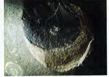
गुफामा देखिएको चन्द्र-सूर्यको प्रतिमा ।