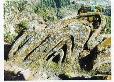
बौद्धगुरु पद्मसम्भवको धर्मपालक भनिएको सर्पको आकृति ।

लामा र केसी ह्योलमो समुदाय र संस्कृतिको खोज-अनुसन्धानमा आबद्ध छन् ।