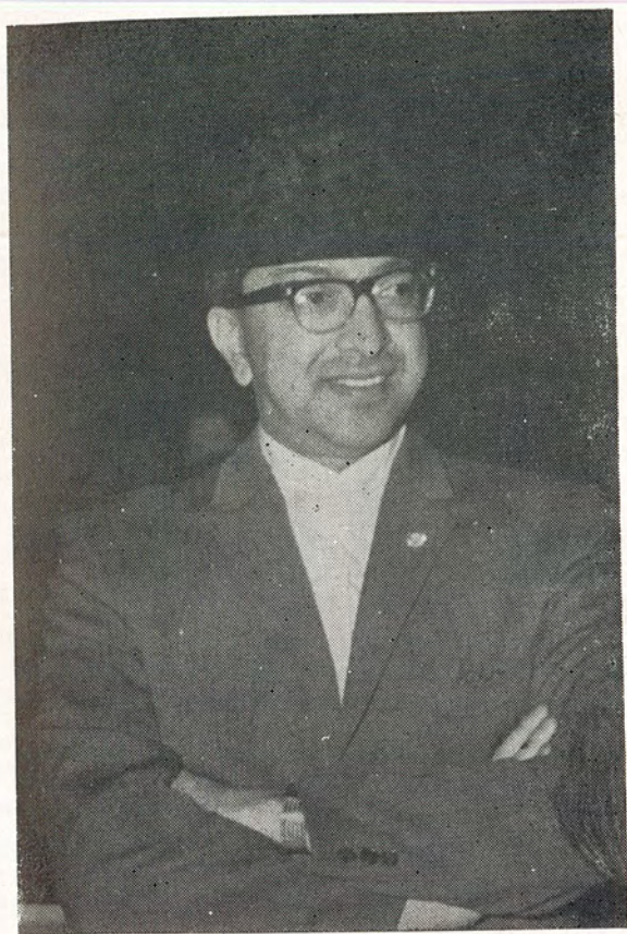
राष्ट्रनायक श्री ५ महेश्वर