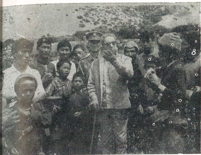
श्री ५ महेन्द्र जनसमूहका साथ