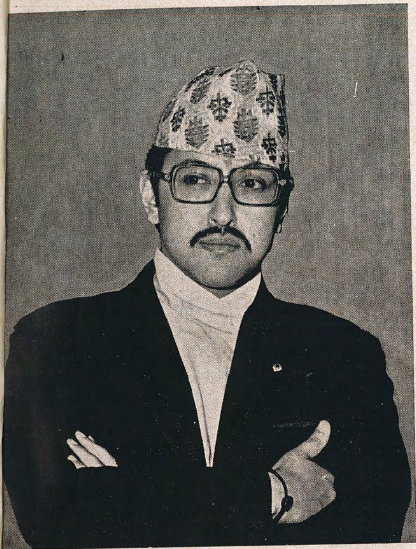
श्री ५ महाराजाधिराज वीरेन्द्र वीर विक्रम शाह देव