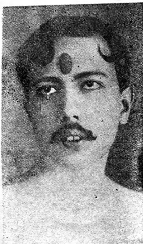
विकास युगका युगनायक नाट्यकवि श्री प्र. गो. द. वा. मे. क. बालकृष्ण शमशेर ज. व. रा. समापति र परीक्षक ने. सा. प.